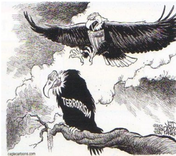
4 Un dessin de presse américain en 2001 (Dessin de Parker, Florida Today, 2001.)

Francis Fukuyama, Le Monde magazine , 2011.