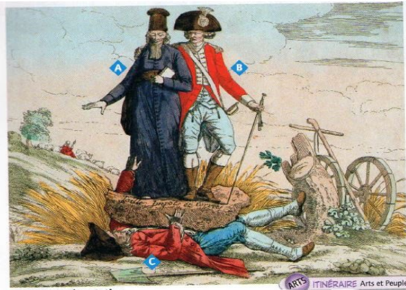
2 Une représentation de la société française Gravure de 1789, Musée Carnavalet, Paris.